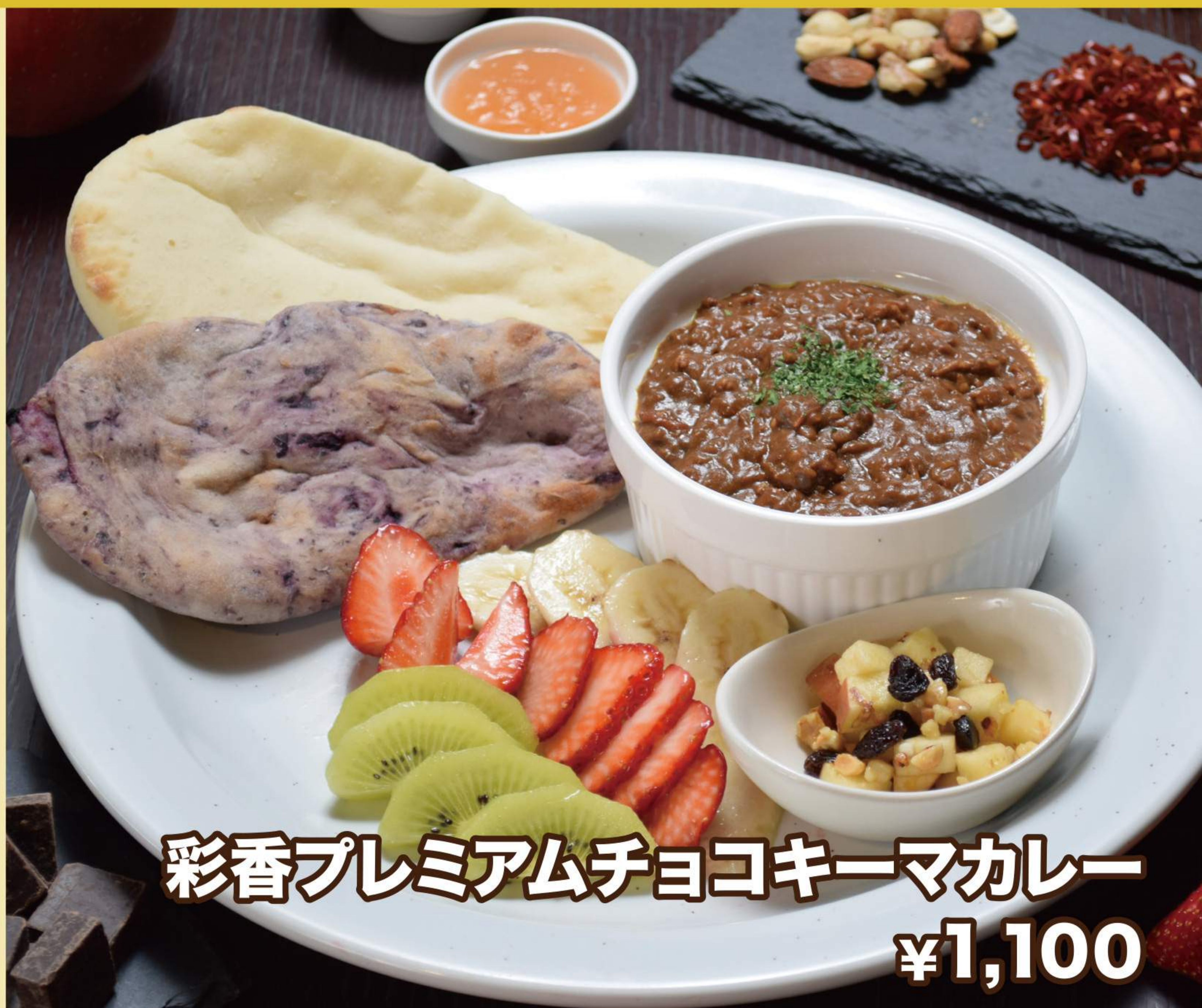
彩香プレミアムチョコキーマカレー ¥1,100