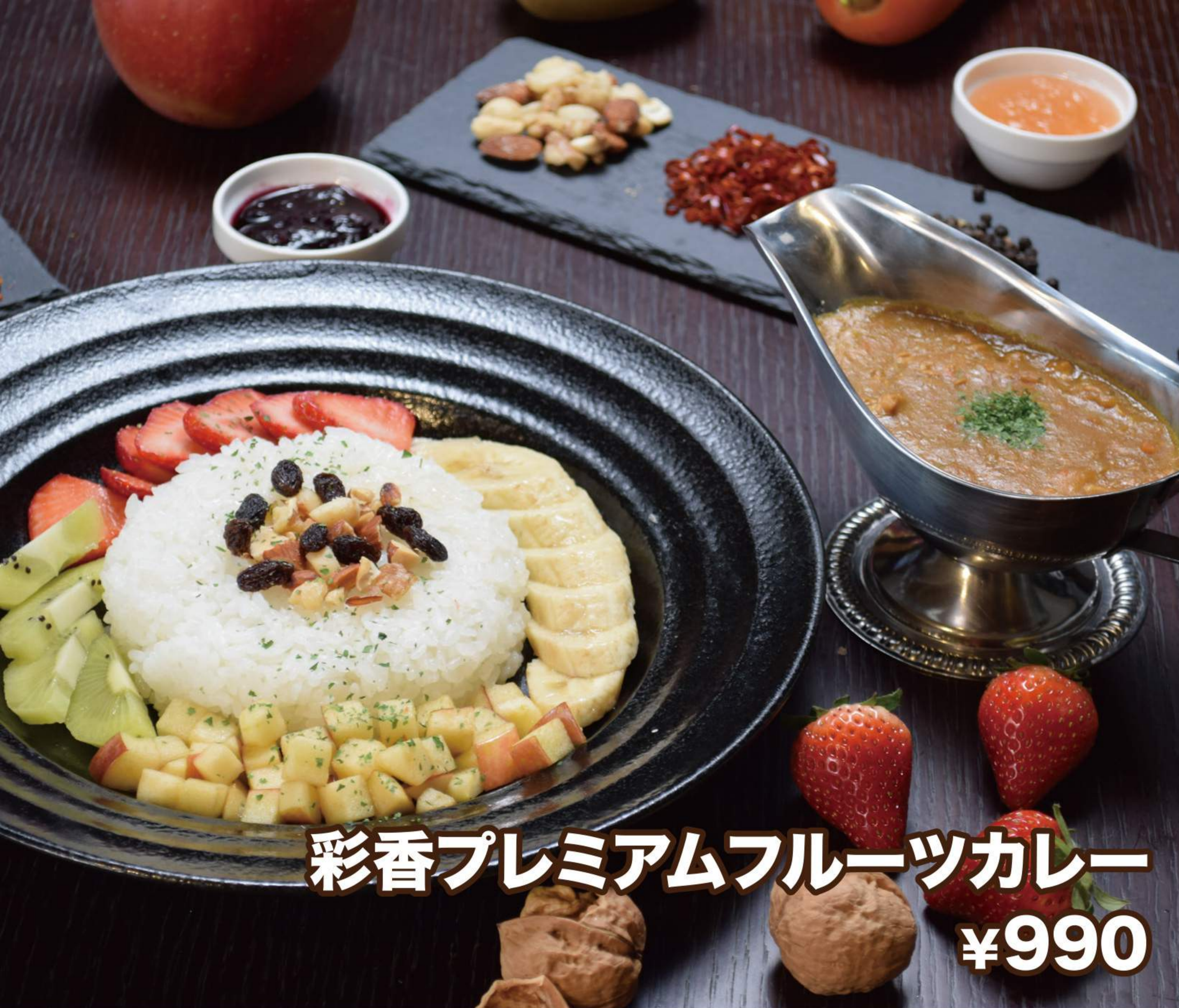
彩香プレミアムフルーツカレー ¥990

信州安曇野の食材にこだわり、 自然なおいしさを追求する あづみ野菓子工房彩香が手掛けた フルーツカレーです。