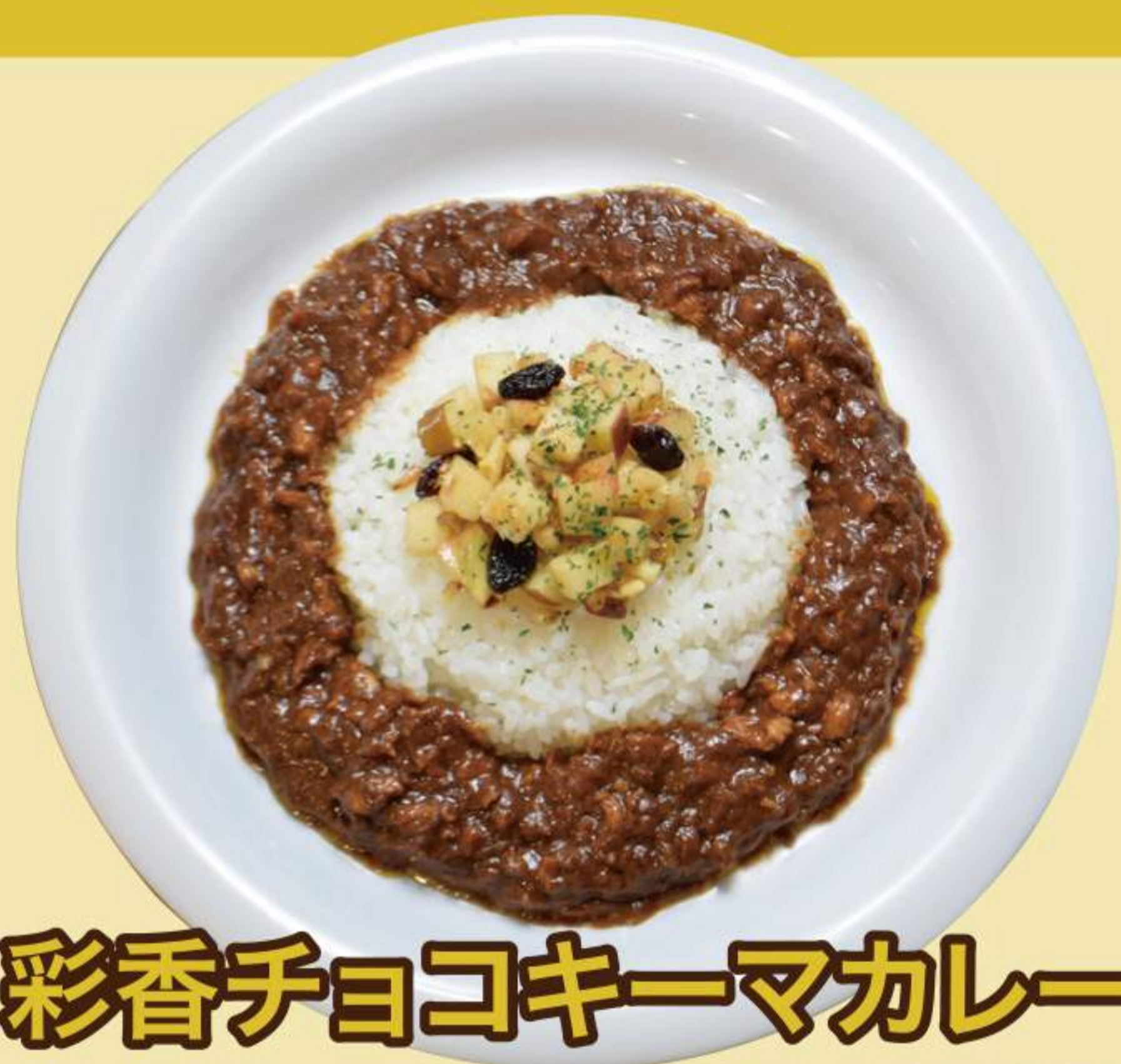
彩香チョコキーマカレー ¥880

彩香フルーツカレーをベースに、 隠し味として チョコレートの深みを加えた チョコキーマカレーです。