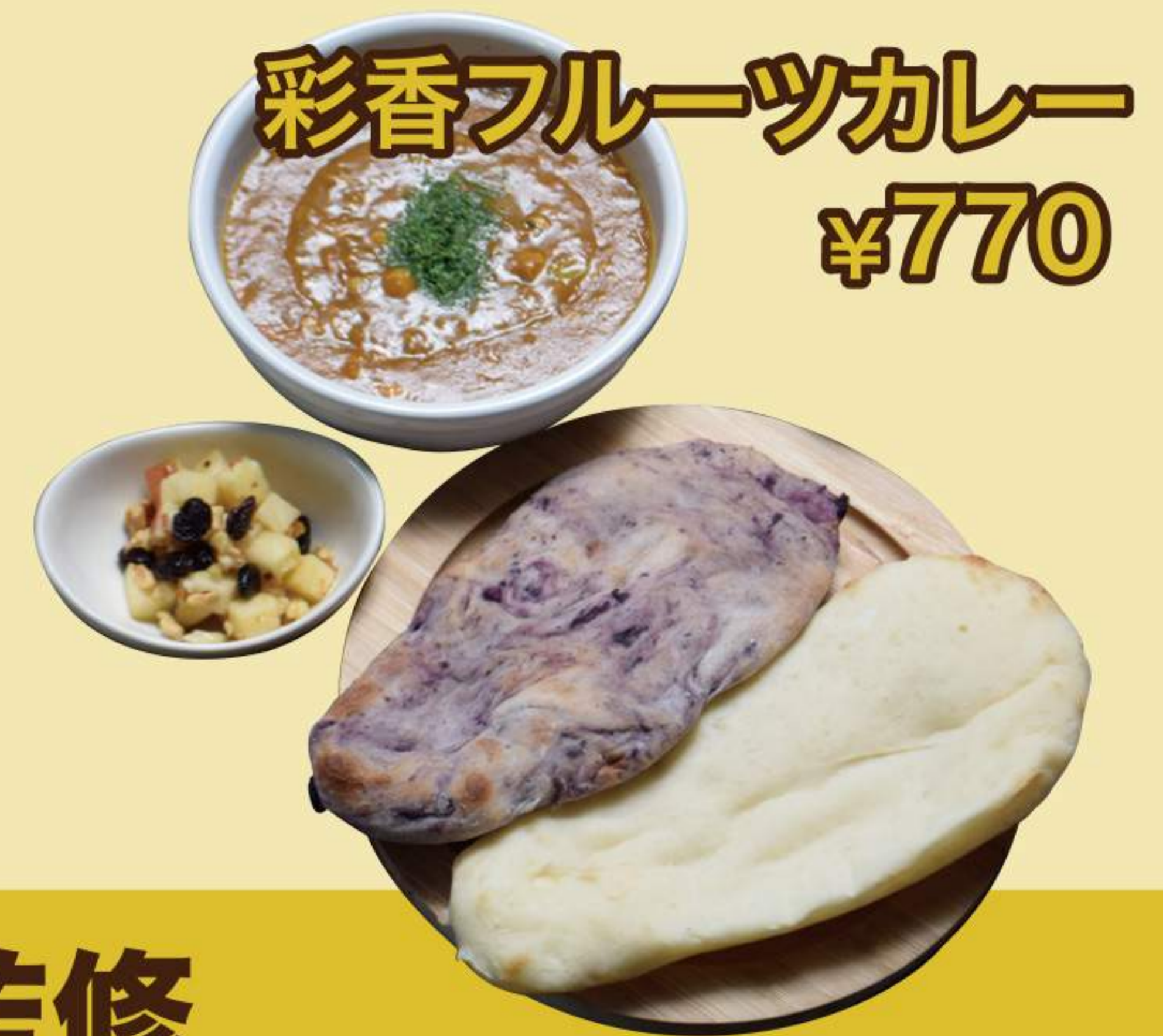
彩香フルーツカレー ¥770